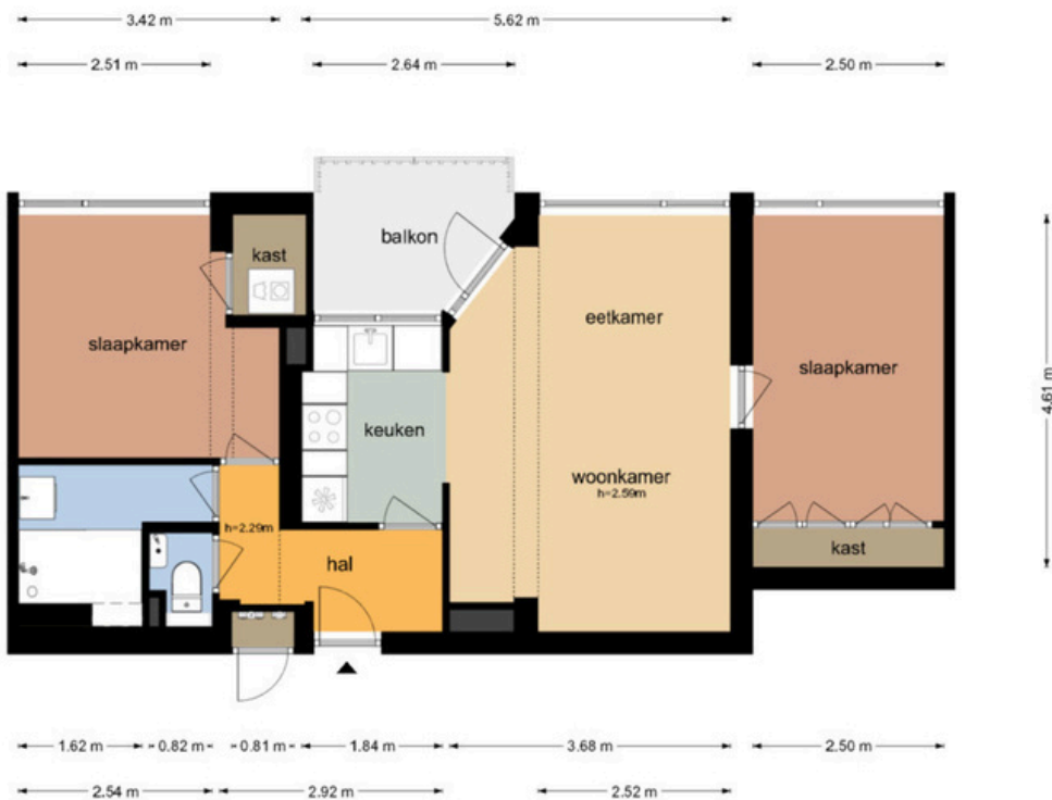
Van Leeuwenhoekstraat 5-0123 - Haarlem Twaalfde Verdieping

De plattegronden zijn geproduceerd voor promotionele doeleinden en ter indicatie. Aan de plattegronden kunnen geen rechten worden ontleend. © www.objectenco.nl